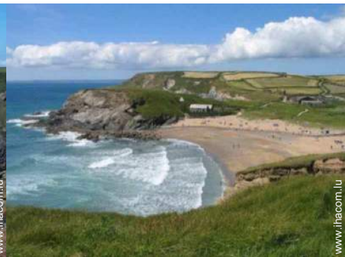
vue sur océan