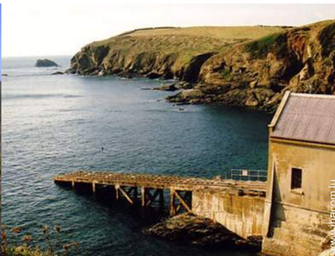
vue sur océan