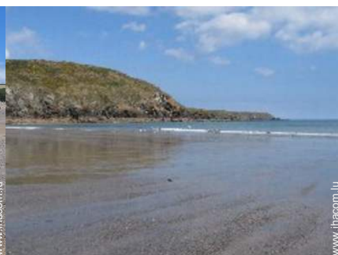
vue sur océan