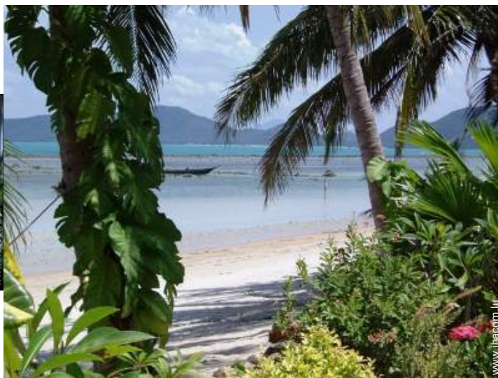
vue sur océan