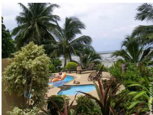
Propriété de Charme