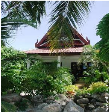
Bungalow de Charme