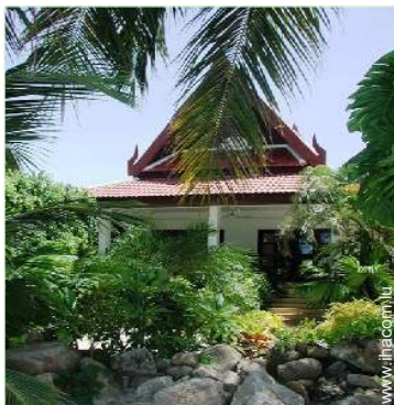
Bungalow de Charme