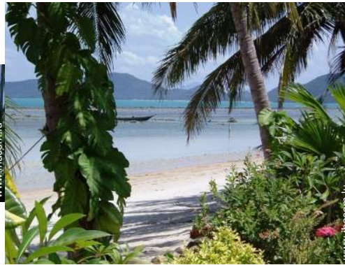
vue sur océan