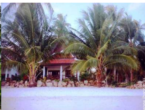
Bungalow de Charme