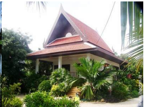
Bungalow de Charme