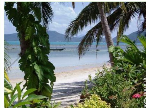
vue sur océan