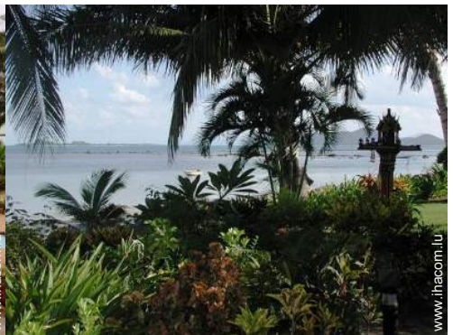
vue sur océan