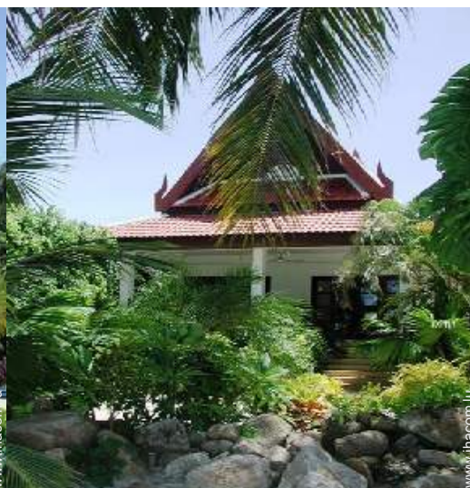
Bungalow de Charme