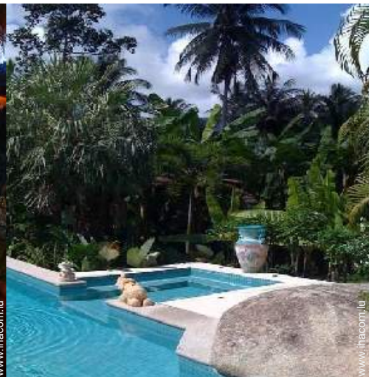
vue sur forêt