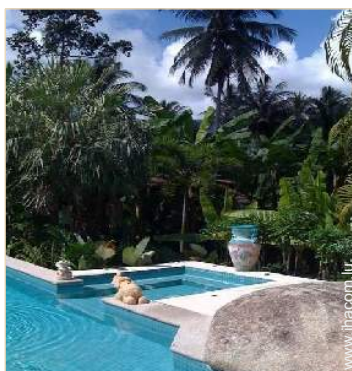
vue sur forêt