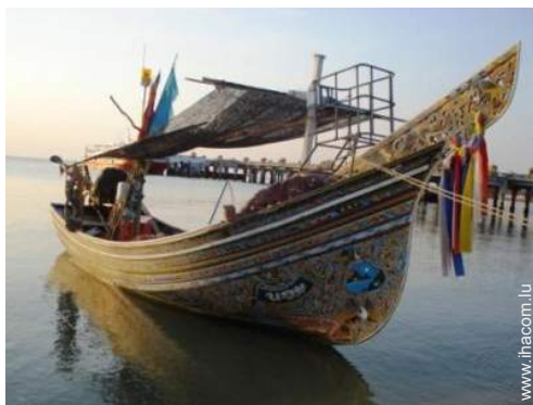
excursion en bateau