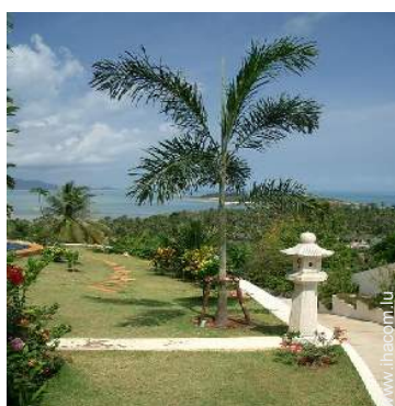
Propriété de Prestige