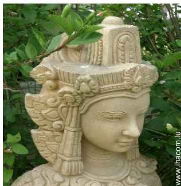
Propriété de Prestige