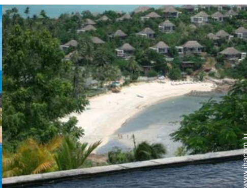
vue sur océan