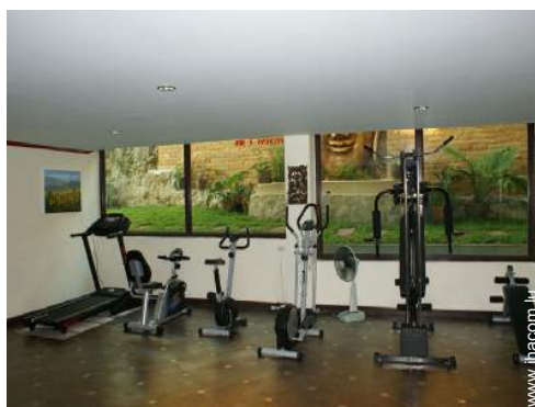
machine(s) de musculation