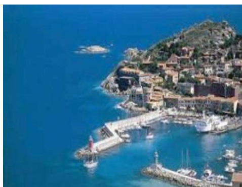
port de plaisance