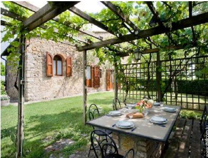
vue depuis le patio