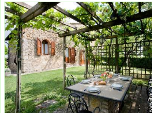
vue depuis le patio