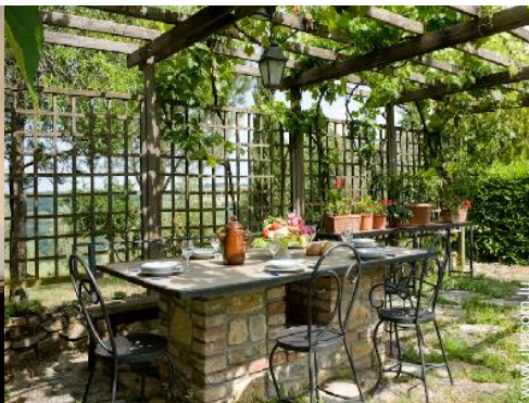
vue depuis le patio