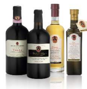
cave et dégustation de vin