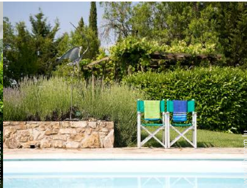
chaise(s) de jardin