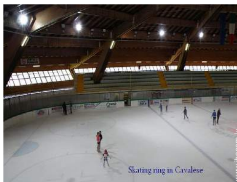
Skating ring in Cavalese