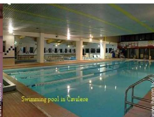
Swimming pool in Cavalese