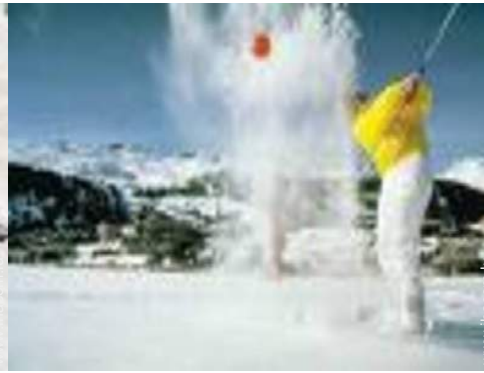
loisirs d'hiver à proximité