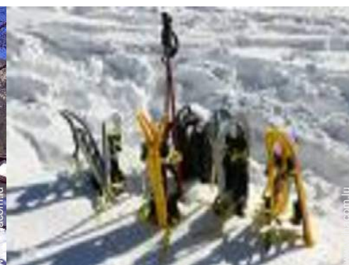
ski de randonnée