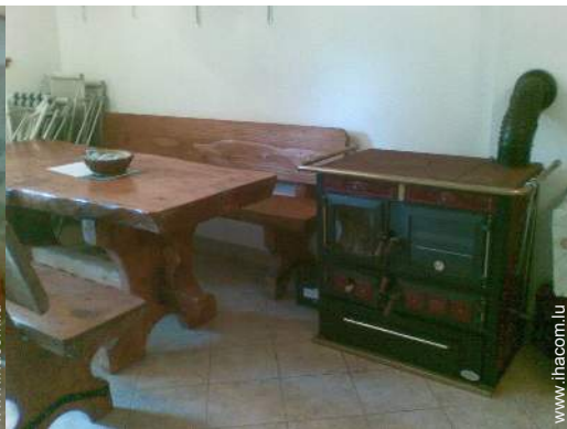
poêle à bois