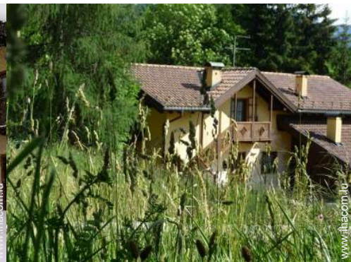
Lotissement de standing