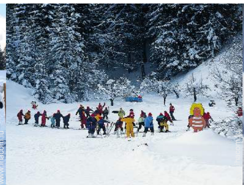
jardin de ski enfant