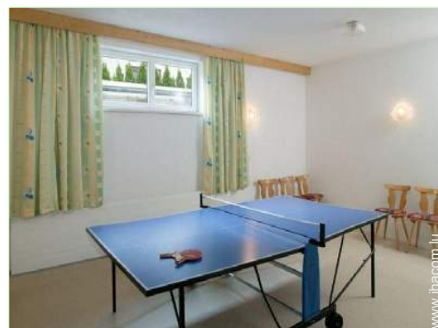
table de ping-pong