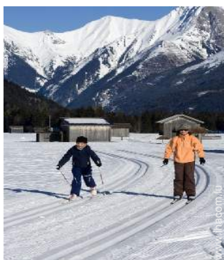
ski de fond