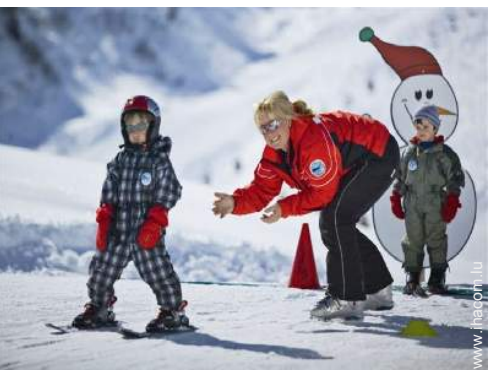
jardin de ski enfant