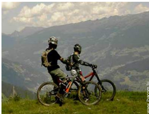
VTT (itinéraire circuit)