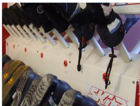
sèche botte ski