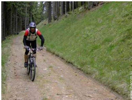
VTT (itinéraire circuit)