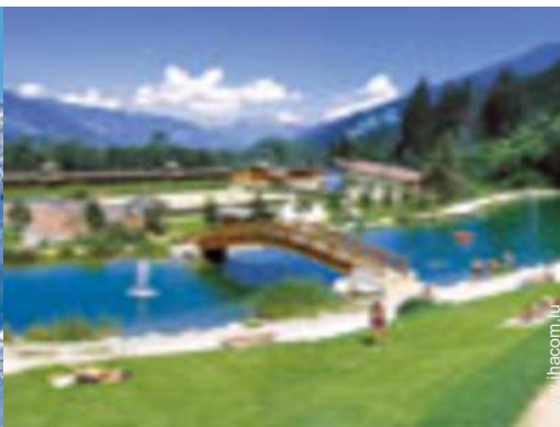
loisirs balnéaires à proximité