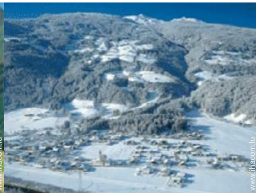
loisirs d'hiver à proximité