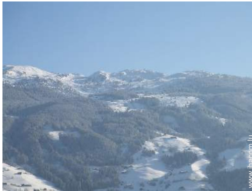
vue sur montagne