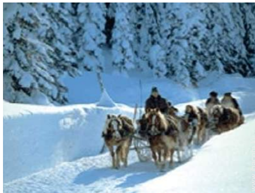
balade en calèche