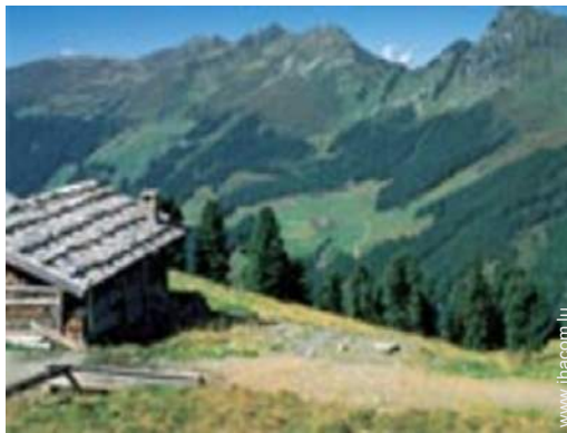
loisirs de montagne à proximité