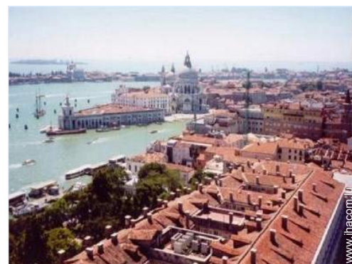
vue sur ville