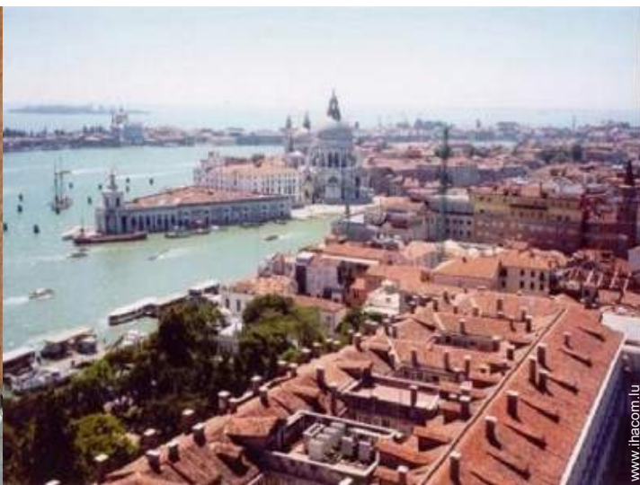
vue sur ville