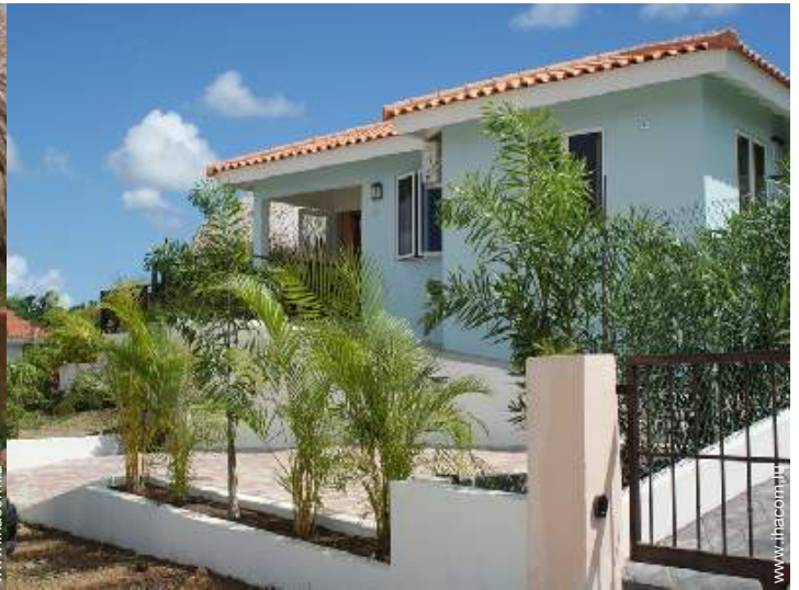
Villa de Charme