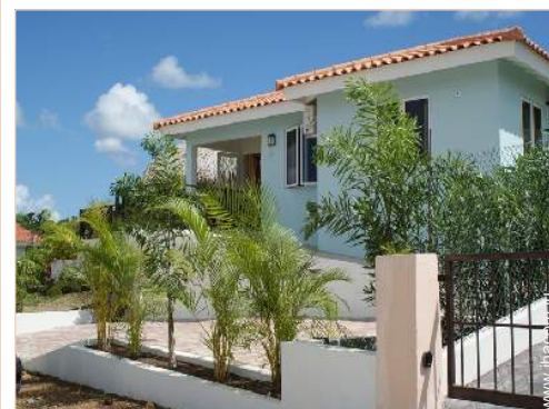
Villa de Charme