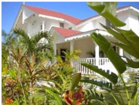
Villa de Charme

Parking non couvert : dans la résidence, 1 place(s) réservée(s)