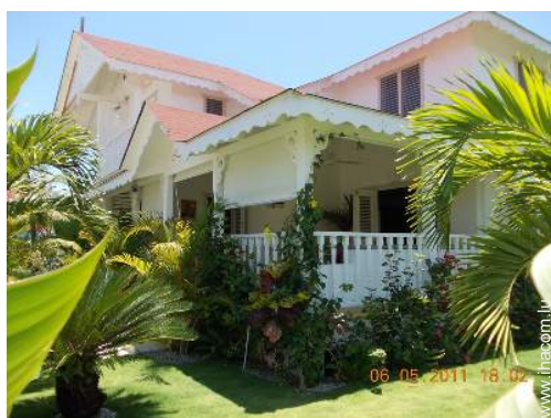
Villa de Charme