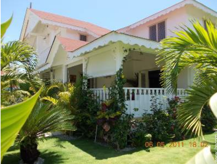
Villa de Charme