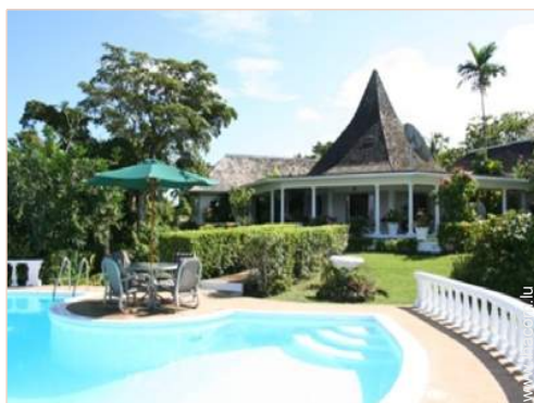
Villa de Charme