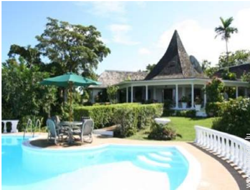
Villa de Charme