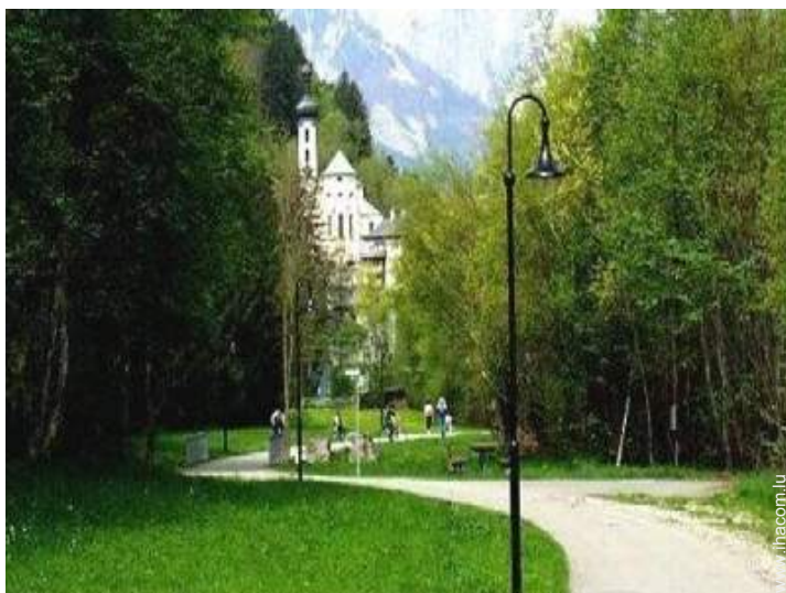
Attraits et détente