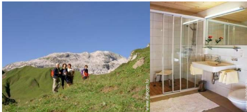
loisirs de montagne à proximité