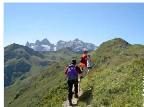
loisirs de montagne à proximité

Barbecue, barbecue à gaz, table(s) de jardin, chaise(s) de jardin, parasol, 4 transat(s), balançoire, portique enfant, bac à sable