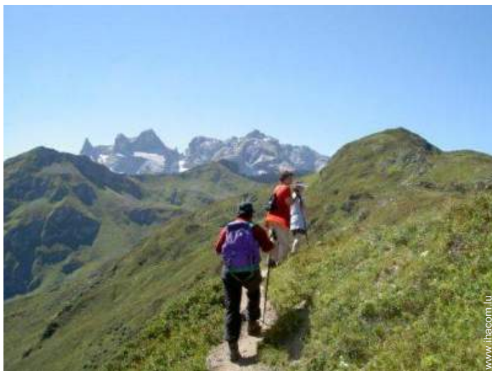
loisirs de montagne à proximité