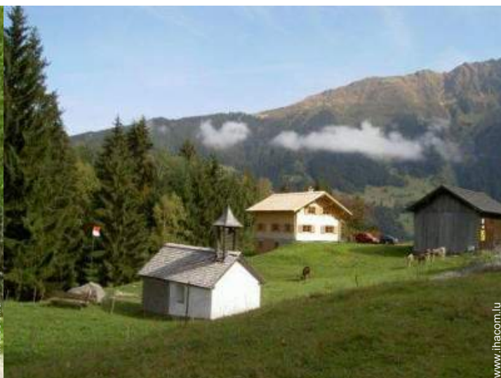
vue sur montagne