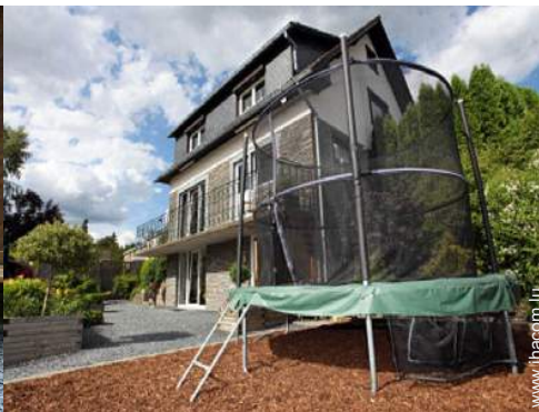
terrain de pétanque