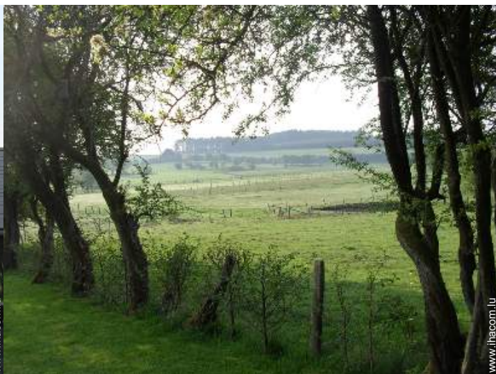
vue sur prairie