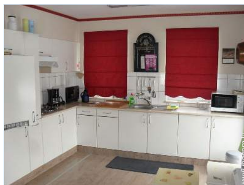
grande cuisine américaine