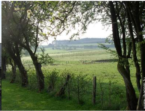
vue sur prairie