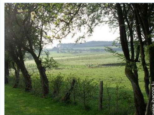
vue sur prairie