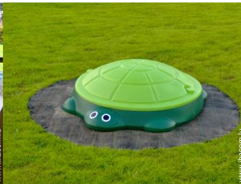
bac à sable