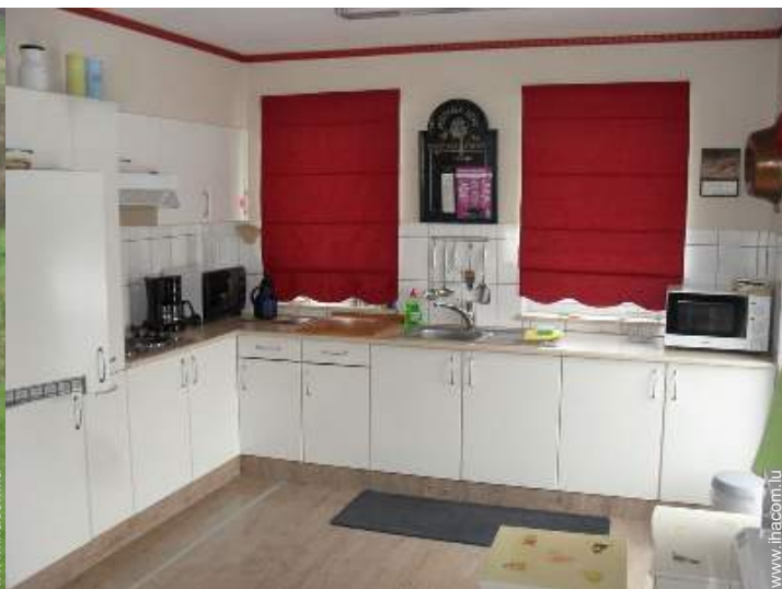
grande cuisine américaine