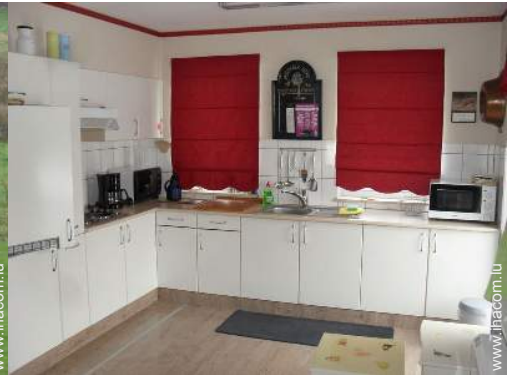
grande cuisine américaine