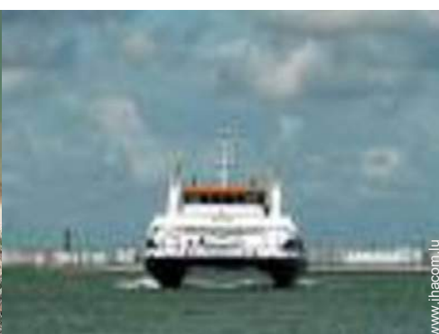
spot de windsurf