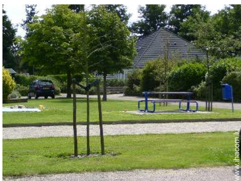
terrain de pétanque