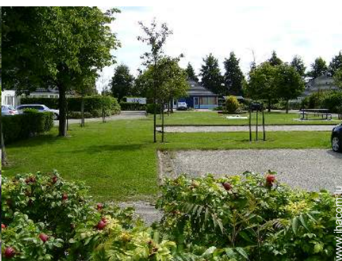
terrain de pétanque